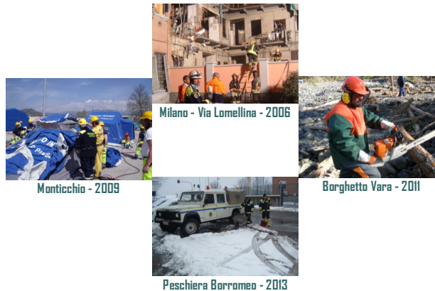
Monticchio - 2009